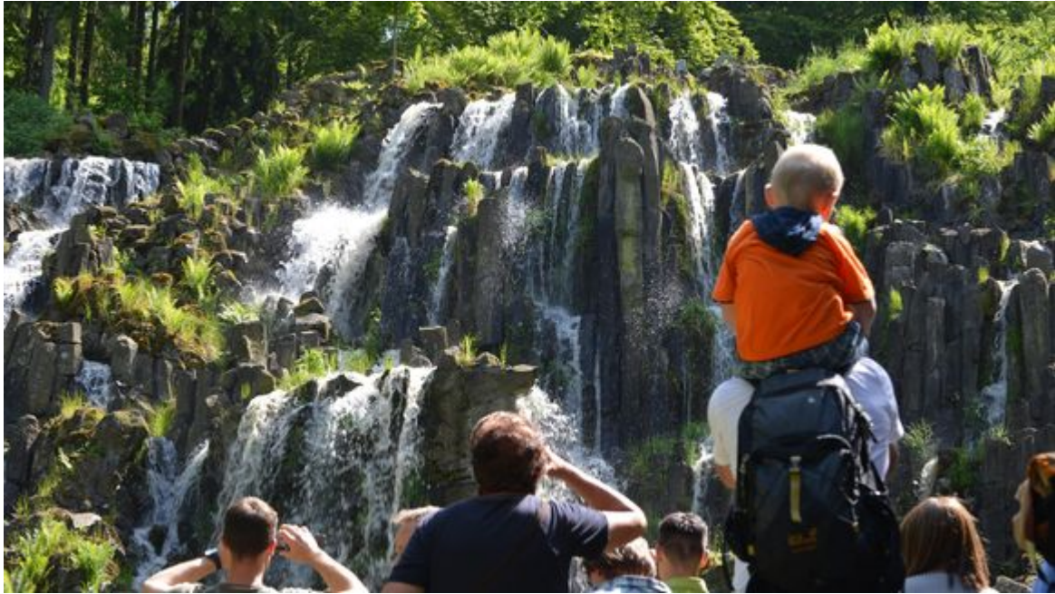
Die Wasserspiele am Steinhoefer Wasserfall im Bergpark

Von außen wirkt das Hirtenhäuschen winzig. Die Tür in der Mitte, rechts und links ein Fenster, ein rotes Ziegeldach mit Schornstein drauf. Was das Häuschen in der Kasseler Mulangstraße besonders macht, ist die Lage: Durch die Sprossenfenster hat man Blick auf einen hübschen Garten mit Apfelbaum – und gleich hinter dem Zaun beginnt ein frisch gekürtes Weltkulturerbe, der Kasseler Bergpark.