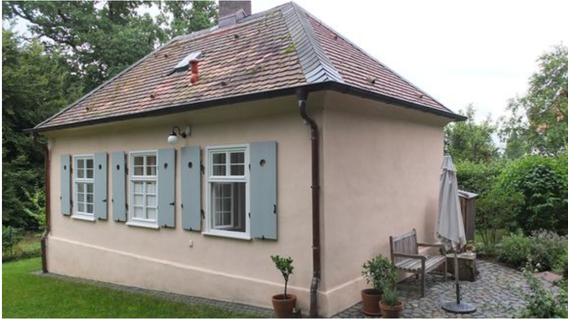
Das Ferienhaus "mulang no. 6"